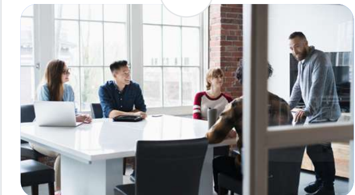
Postgrado en Valoración de Empresas