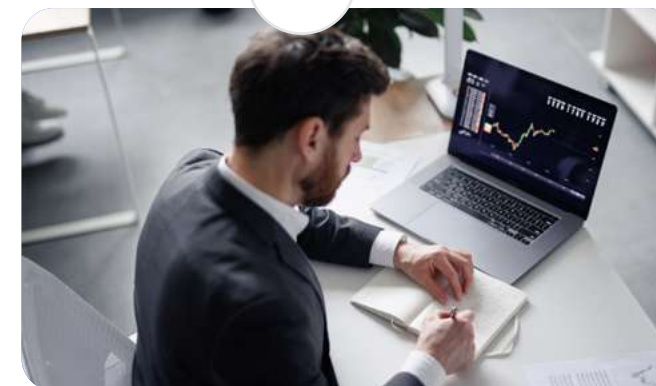
Postgrado en M&A y Banca de Inversión